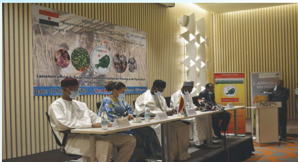
La table de séance à l'ouverture de la cérémonie de lancement

Ce projet s'est fixé comme objectif «d'augmenter la productivité agricole et l'accès aux marchés pour les petits et moyens agriculteurs et les petites et moyennes entreprises agroalimentaires dans les régions participants aux projets». Sa finalité est la transformation du monde rural à travers l'amélioration durable de la sécurité alimentaire et nutritionnelle et les revenus des différents acteurs intervenant dans les chaînes de valeur des filières végétales (oignon, niébé fourrager, sésame, pomme de terre, tomate, riz et poivron), des filières animales (bétail-viande, aviculture, lait et cuirs et peaux) et la pisciculture. Prévu pour un délai d'exécution de six ans, le PIMELAN est financé par un crédit de l'IDA, d'un montant équivalent à 100 millions de dollars US, accordé au Gouvernement du Niger. La Société Financière Internationale (SFI) fournira 6 millions de dollars US, les bénéficiaires contribueront pour 5,9 millions de dollars US et les Institutions Financières Partenaires fourniront 23 millions de dollars US, soit un coût total de 134,9 milliards de FCFA. La zone d'intervention du projet couvre six régions dont trois régions affectées par un conflit, dites zones fragiles (Diffa, Tillabéri et Tahoua) et trois autres régions Agadez, Niamey et Zinder.