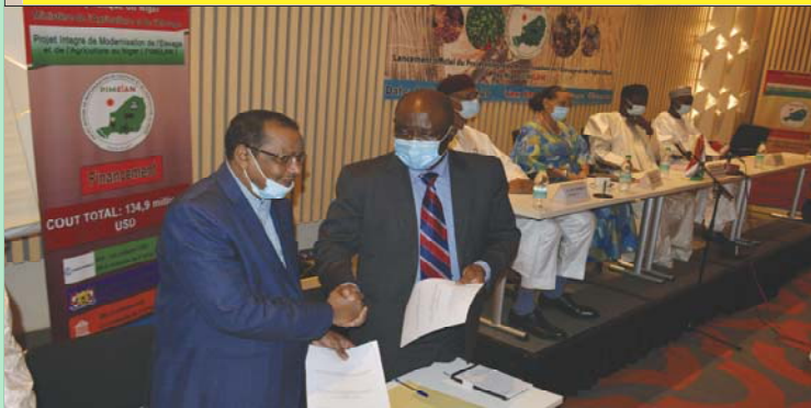
Echange de documents tout juste après la signature de convention de partenariat avec des banques