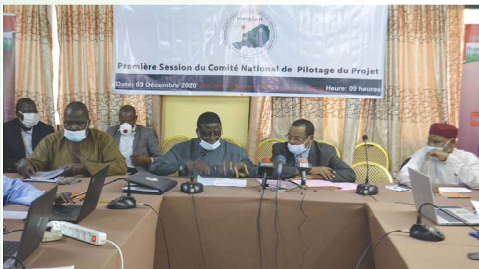
A la 1 ère session ordinaire du Comité National de Pilotage

A l'ouverture des travaux, le Secrétaire général du ministère de l'Agriculture et de l'Élevage a déclaré que le PIMELAN, dont l'objectif de développement est «d'augmenter la productivité agricole et l'accès aux marchés pour les petits et moyens agriculteurs et les petites et moyennes entreprises agroalimentaires dans sa zone d'intervention», est financé par la Banque Mondiale sur un crédit IDA de 100 millions de dollars US pour une durée de six (6) ans. Il a précisé que ce projet couvre six régions dont Diffa, Tillabéry, Tahoua, Agadez, Niamey et Zinder. Sa finalité est la transformation du monde rural à travers l'amélioration durable de la sécurité alimentaire et les re-