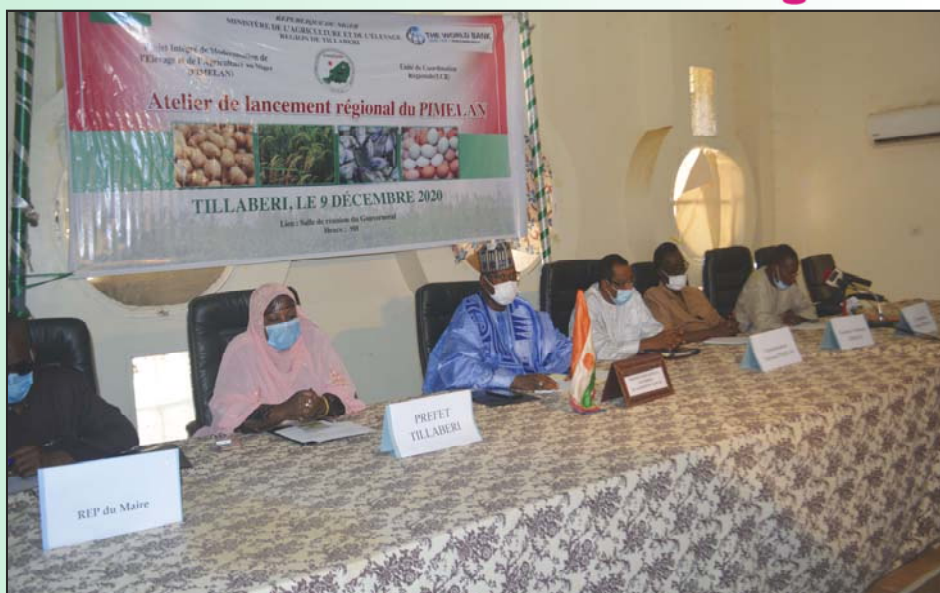
La table de séance au lancement des activités régionales du PIMELAN à Tillabéri

Dans son discours d'ouverture, le gouverneur a salué la présence du Pimelan à Tillabéri avant de s'appesantir sur les potentialités dont regorge la région. Il a indiqué que la présence du PIMELAN est une opportunité à saisir par les femmes et les jeunes déjà engagés dans la transformation et la production des produits agrosylvo-pastoraux pour mieux valoriser leur travail afin de tirer plus de revenus et renforcer leur autonomisation.