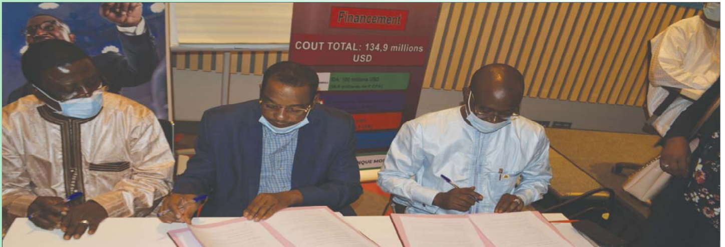
Lors de la signature de conventions avec les banques partenaires en marge du lancement national