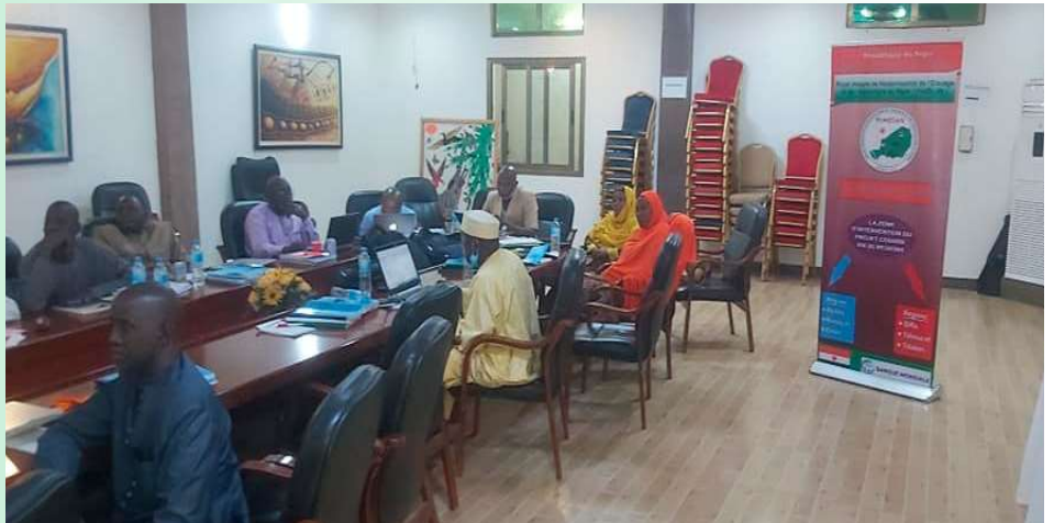
Une vue des participants à l'atelier de Dosso