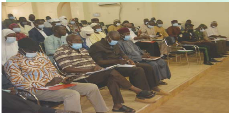
Une vue des participants au lancement régional du PIMELAN à Tillabéri