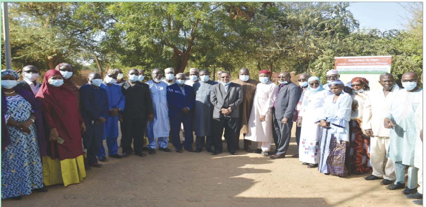
Photo de famille des membres du Comité National de pilotage