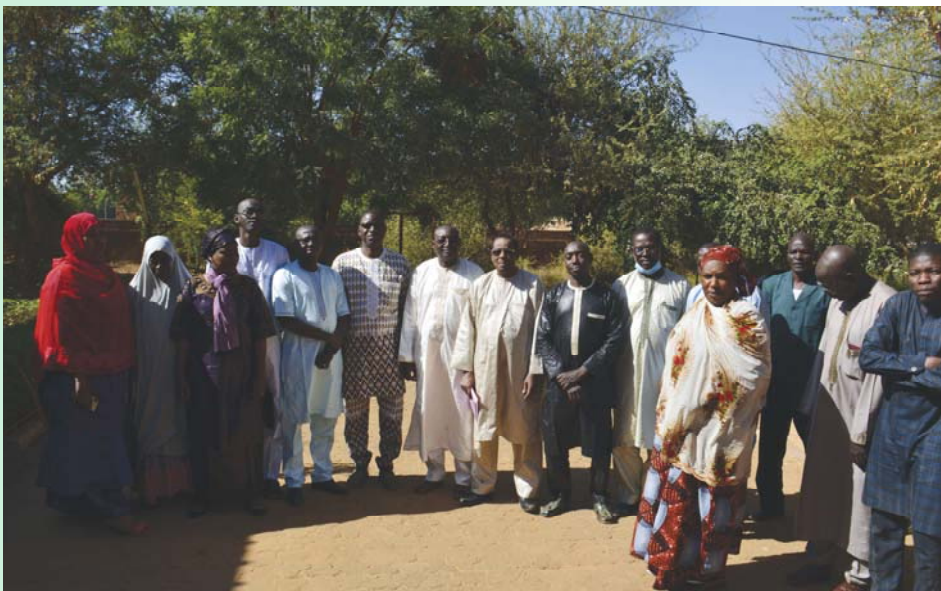
Photo de famille des comptables avec le Coordonnateur National du PIMELAN

formation avant de leur dire d'être attentifs et proactifs pour engranger le maximum des avantages du logiciel.