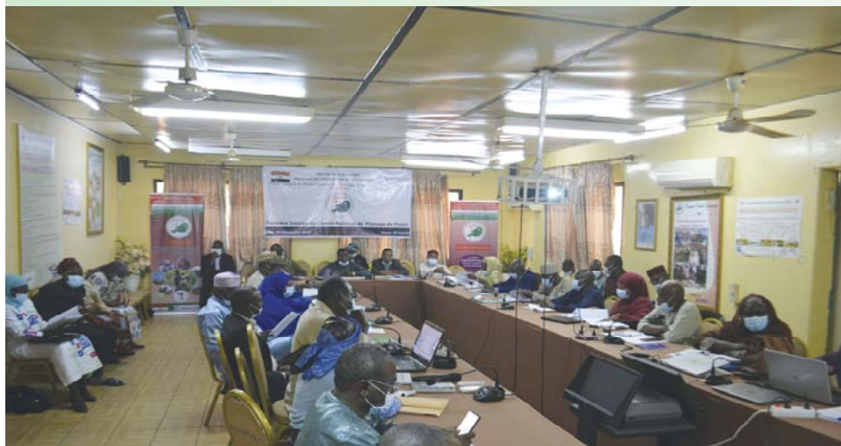
Une vue des participants à la session ordinaire du Comité National de Pilotage