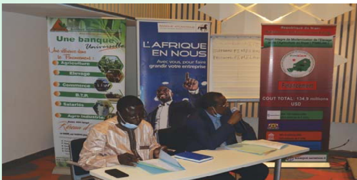
Signature de conventions avec les banques partenaires en marge du lancement national