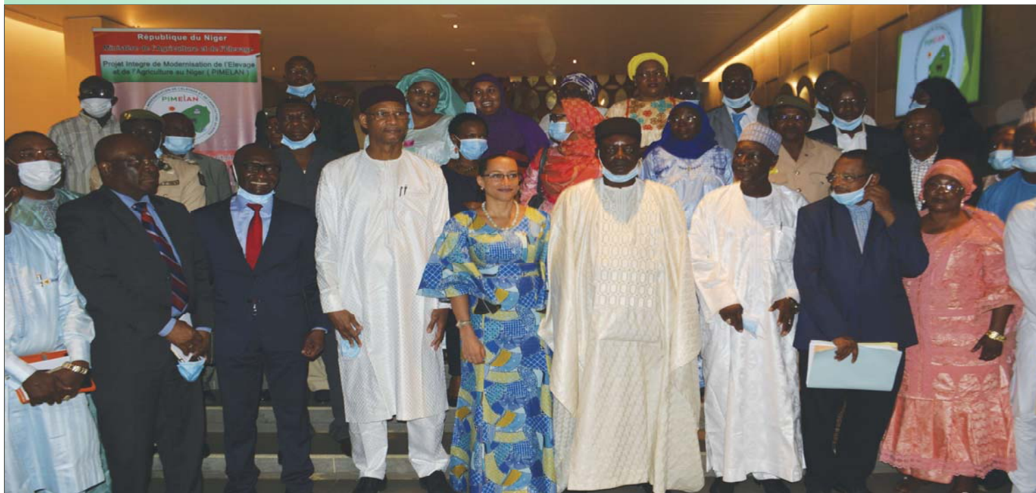
Photo de famille à l'issue de la cérémonie de lancement national du PIMELAN