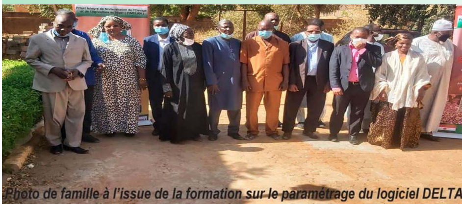
Photo de famille à l'issue de la formation sur le paramétrage du logiciel DELTA