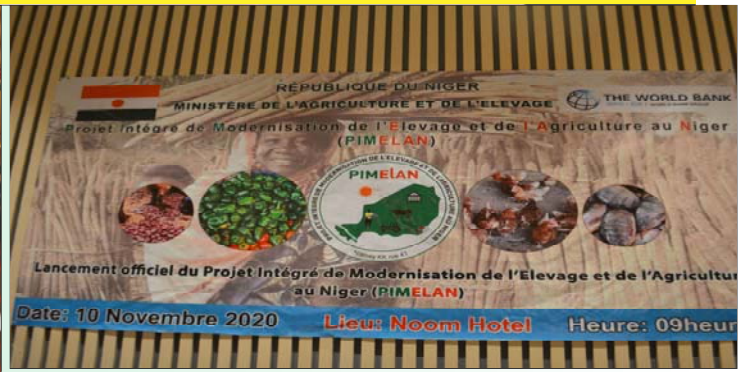
Quelques chaînes de valeurs concernées par le financement