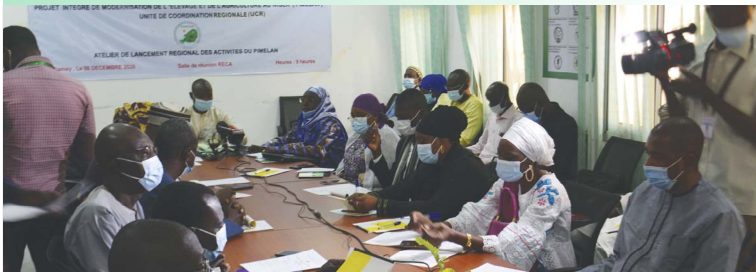
Les participants au lancement du PIMELAN dans la Région de Niamey